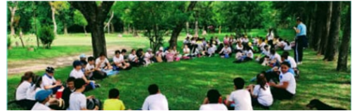
Imádság, szemlélődés, elmélkedés és munka a diákokkal

A program három területre fókuszált: ünneplés-liturgia, konkrét tettek és figyelemfelkeltés. Kezdetben mindez nagyon nehéznek tűnt, de később a javaslatok kreativitása és minősége valódi lehetőséget kínált a tapasztalatszerzésre. A munka során szerzett öröm felülmúlta a felmerülő nehézségeket, különösen miután megfigyelhettük a gyerekekben bekövetkezett változásokat az integrált ökológia területén szerzett tapasztalatok hatására. A projekt során végzett munkánk arra motivált bennünket, hogy begyógyítsuk a sebeket, növekedjünk a Teremtő Isten iránti hálában, hogy tudatosak, felelősek és tisztelettudóak legyünk mindazzal, ami körülvesz bennünket. Annak tudatában kezdtünk élni, hogy az egész Teremtés ajándék, és a róla való gondoskodás a mi feladatunk.