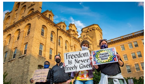
A "Fekete életek szentek" - nyilvános tanúságtétel az Elm Grove-ban tavaly ősszel

3) Rendszerszintű rasszizmus - Shalom Irodánk és a Faji Igazságosság Bizottságunk vezető szerepet vállal a faji előítéleteket és a fehér felsőbbrendűség kultúráját elősegítő vagy fenntartó politikák és gyakorlatok (például a bevándorlás, az egészségügy, az oktatás, a választási rendszer, az igazságszolgáltatás, a gazdasági esélyteremtés, a környezetvédelmi kérdések stb. területén) elleni küzdelemben.