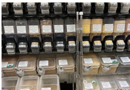
A műanyag csomagolás beszüntetése a tömegcikk osztályon, Outpost Natural Foods, Milwaukee, Wisconsin

Kreatív emberi mivoltunknál fogva, a Küldetések Van és a Laudato Si' lelkeséget követő bolygó lakóiként, mi, a Boldogasszony Iskolanővérek aktívan keressük a mindenütt jelenlévő műanyag alternatíváját.