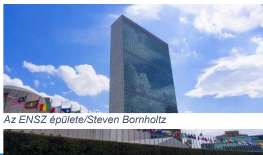
Az ENSZ épülete/Steven Bornholtz

Link (magyar nyelvű): https://un75.online/?lang=hun