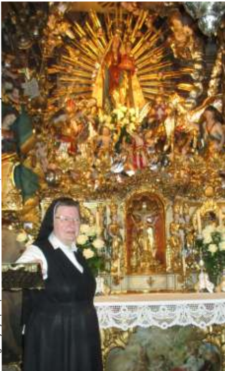
sestra M. Eresta razlaga kapele