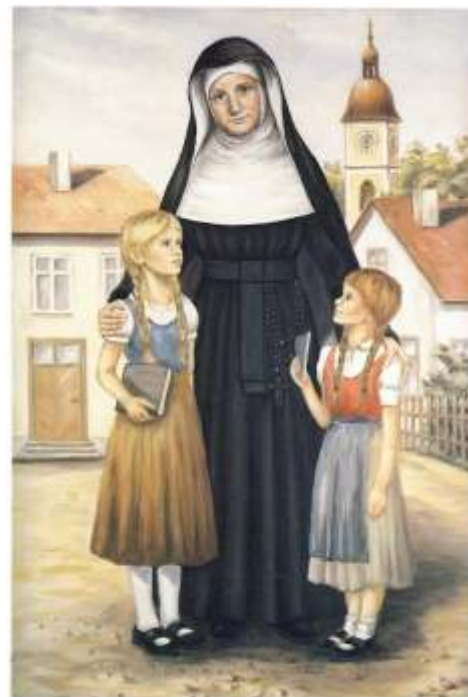
Wizerunek naszej Założycielki z uroczystości beatyfikacji.

Modlimy się, aby każdy z nas był człowiekiem pokoju, nadziei i miłości. Ponieważ wszyscy jesteśmy powołani i wszyscy jesteśmy posłani.