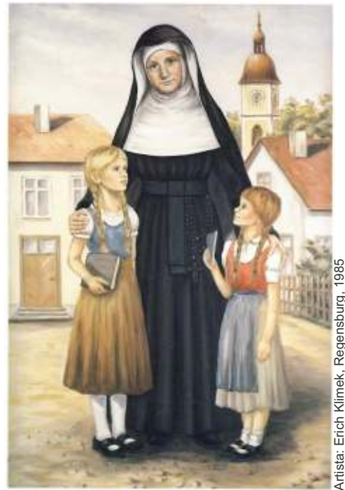
Artista: Erich Klimek, Regensburg, 1985

Nuestra oración es que todas nosotras seamos personas de paz, esperanza y amor. Porque todas hemos sido llamadas y todas somos enviadas.